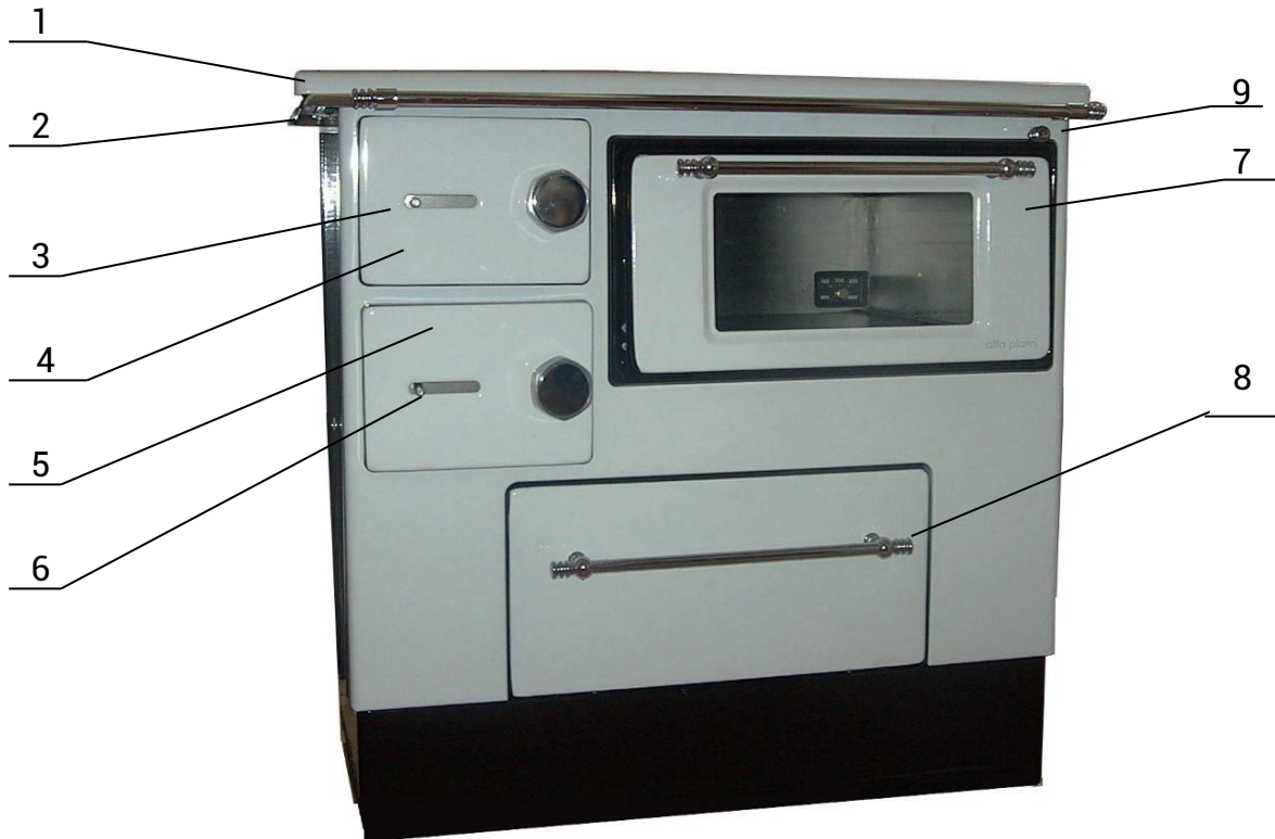
Slika br. 1

Pri izgradnji objekta i dimnjaka na njemu važi pravilo da se moraju poštovati građevinski i protivpožarni propisi, kao i svi potrebni lokalni, nacionalni i evropski propisi i norme.