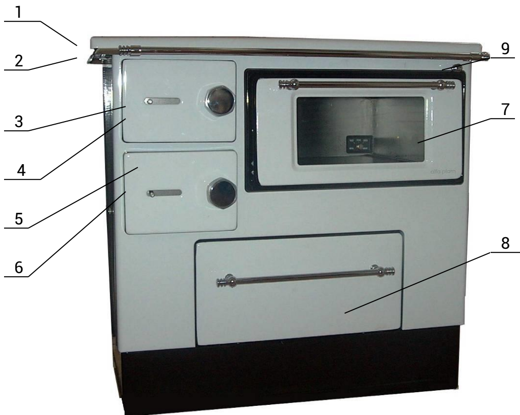
Slika br. 1

Pri izgradnji objekta i dimnjaka na njemu važi pravilo da se moraju poštovati građevinski i protivpožarni propisi, kao i svi potrebni lokalni, nacionalni i evropski propisi i norme.